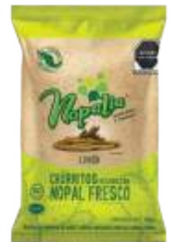
CHURRITOS DE NOPAL SABOR LIMÓN