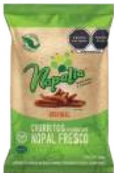
CHURRITOS DE NOPAL SABOR ORIGINAL