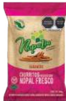
CHURRITOS DE NOPAL SABOR HABANERO