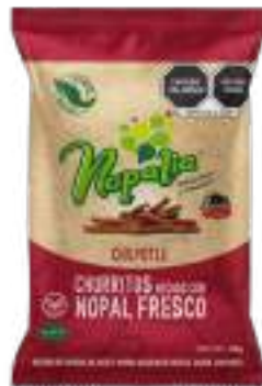
CHURRITOS DE NOPAL SABOR CHILPOTLE